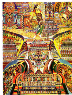
AUGUSTO TOSI L'ESPACE Composition psychologique Gros 100x100 cm, huile sur toile, 16 x 17 cm, Courtesy galerie Les Yeux Fertiles