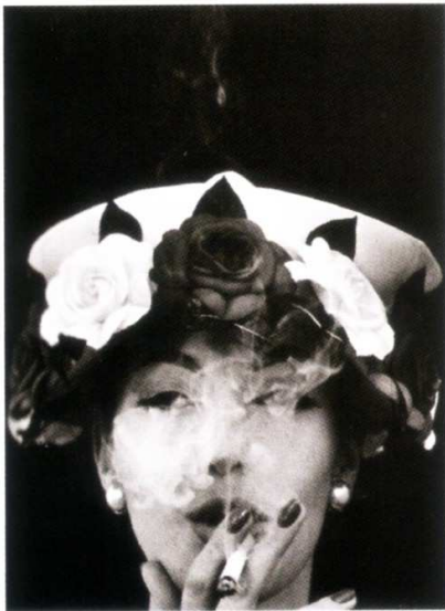
William Klein, Hat and five roses, Paris, 1956

P. Horst et Cecil Beaton se frottent aux tirages de Sarah Moon, Bert Stern ou William Klein. Y. Y.