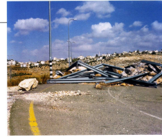
Sophie Ristelhuber, 88 , 2005, tirage argentique encadré sur aluminium (©Sophie Ristelhuber/Courtesy GalerieMarseille, Marseille).