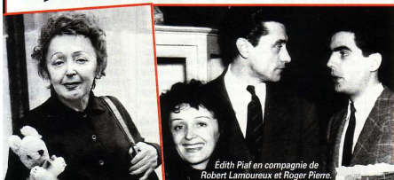
« Édith Piaf a organisé un dîner réunissant ses anciens amants »