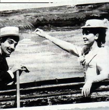
« Gréco s'est toujours mariée par politesse »