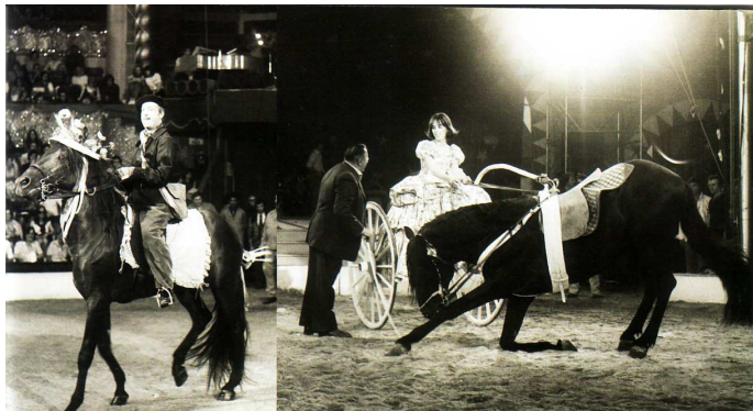
Michel Serrault au Cirque d'Hiver en 1975.

Des spectacles de qualité pour finir l'année en beauté !